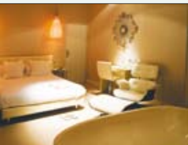
◀ Cama colgante