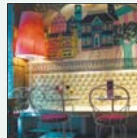
▲ Beauty Bar

► Teléfono: 91 531 47 44. Fax: 91 521 44 92